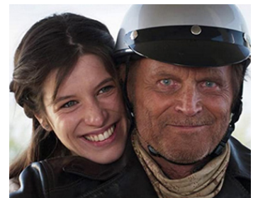
2018 MY NAME IS THOMAS (La chiamavano Maryam) de Terence Hill avec Veronica Bitto