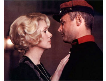
1977 IL ÉTAIT UNE FOIS LA LÉGION (March of die) de Dick Richards avec Catherine Deneuve