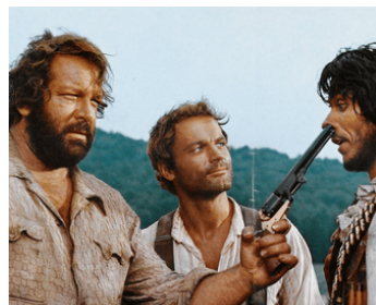
1970 ON L'APPELLE TRINITA (Lo chiamavano Trinità) d'Enzo Barboni avec Bud Spencer