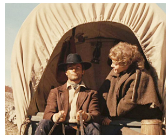
1970 DJANGO, PRÉPARE TON CERCUEIL (Preparati la bara!) de F. Baldi avec A. Minervini