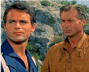
1964 LE TRÉSOR DES MONTAGNES BLEUES (Winnetou 2) d'H. Reini avec Lex Barker