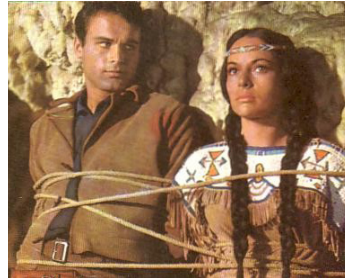
1964 PARMIS LES VAUTOURS (Unter Geiern) d'Alfred Vohrer avec Karin Dor