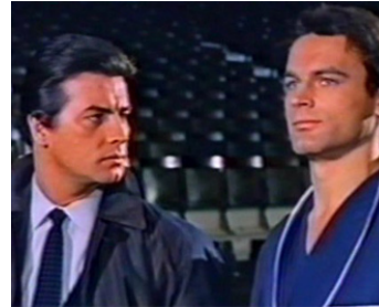
1965 DU SUIF DANS L'ORIENT-EXPRESS (Schuße im 3/4 Takt) d'A. Weidenmann avec Pierre Brice