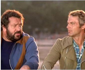
1974 ATTENTION, ON VA S'FÂCHER ! (Altrimenti ci arrabbiamo) de M. Fondato avec Bud Spencer