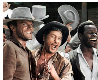
1968 LES 4 DE L'AVE MARIA (I quattro dell'Ave Maria) de G. Colizzi avec E. Wallach, Brock Peters