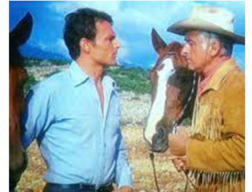
1965 L'APPÂT DE L'OR NOIR (Der Ölprinz) d'Harald Philipp avec Stewart Granger