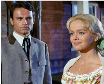
1965 MASSACRE À LA FRONTIÈRE (Old Surehand) d'A. Vohrer avec Letitia Roman