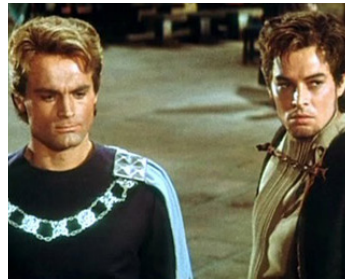
1966 LA VENGEANCE DE SIEGFRIED (Die Nibelungen) d'Harald Reini avec Uwe Beyer