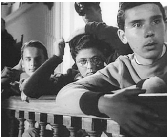
1952 LA MAISON DU SILENCE (La voce del silenzio) de Georg W. Pabst avec Ezio Rossi