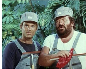
1981 SALUT L'AMI, ADIEU LE TRÉSOR (Chi trova un amico...) de Sergio Corbucci avec Bud Spencer