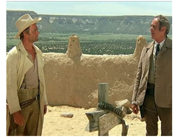
1973 MON NOM EST PERSONNE (Il mio nome è Nessuno) de Tonino Valerii avec Henry Fonda