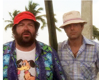
1978 PAIR ET IMPAIR (Pari e dispari) de Sergio Corbucci avec Bud Spencer