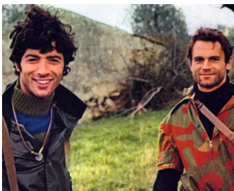
1969 BARBAGIA (La società del maessere) de Carlo Lizzani avec Don Backy