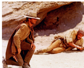
1967 DIEU PARDONNE, MOI PAS (Dio perdona... io no!) de Giuseppe Colizzi avec Bud Spencer