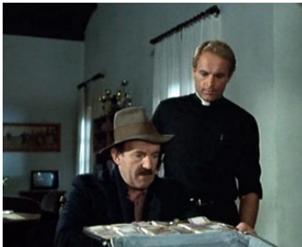
1984 DON CAMILLO (Don Camillo) de Terence Hill avec Colin Blakely