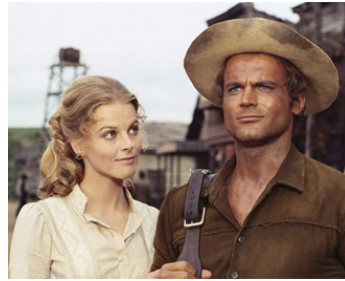
1972 ET MAINTENANT, ON L'APPELLE EL MAGNIFICO d'E. Barboni avec Yanti Somer