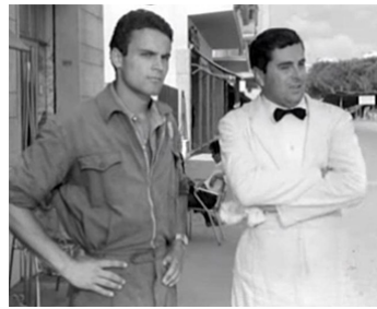
1958 POUSSE PAS GRAND-PÈRE DANS LES ORTIES (Juke box) de M. Morassi avec A. Giuffrè