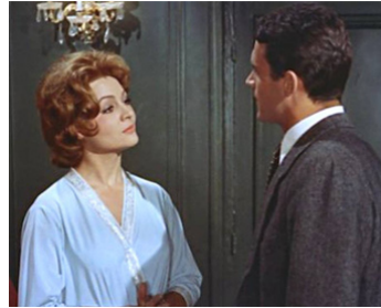
1961 AVE MARIA (Pecado de amor) de Luis César Amadori avec Sara Montiel