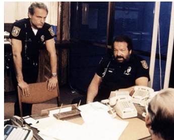
1985 LES SUPER-FLICS DE MIAMI (Miami Supercops) de Sergio Corbucci avec B. Spencer