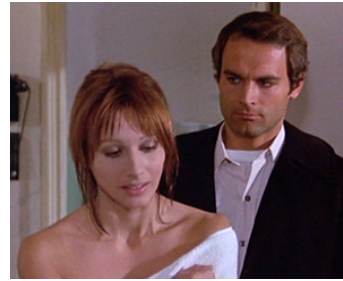
1972 IL VERO È IL FALSO d'Eriprando Visconti avec Shirley Corrigan