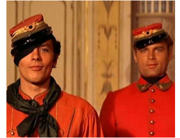
1963 LE GUÉPARD (Il Gattopardo) de Luchino Visconti avec Alain Delon