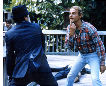
1983 QUAND FAUT Y ALLER, FAUT Y ALLER (Nati con la camicia) d'Enzo Barboni