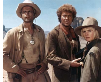
1975 UN GÉNIE, DEUX ASSOCIÉS, UNE CLOCHE de D. Damiani avec R. Charlebois, Miou-Miou