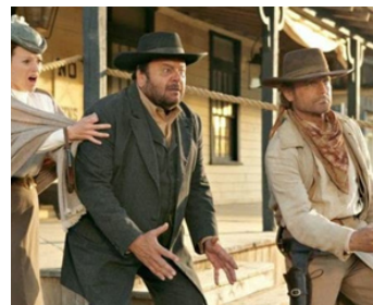
2009 DOC WEST (Doc West) de Terence Hill avec Clare Carey, Paul Sorvino