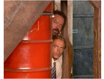
1984 ATTENTION LES DÉGÂTS (Non c'è due senza quattro) d'Enzo Barboni avec Bud Spencer