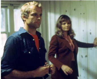
1977 ON M'APPELLE DOLLARS (Mister Miliardo) de Jonathan Kaplan avec Valerie Perrine