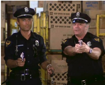
1980 UN DRÔLE DE FLIC (Poliziotto superpiù) de Sergio Corbucci avec Ernest Borgnine