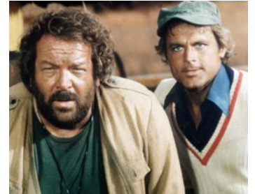
1979 CUL ET CHEMISE (Io sto con gli ippopotami) d'Italo Zingarelli avec Bud Spencer