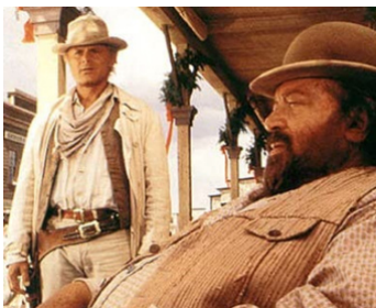
1994 PETIT PAPA BASTON (Botte di Natale) de Terence Hill avec Bud Spencer