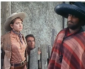
1967 T'AS LE BONJOUR DE TRINITA (Little Rita nel west) de F. Baldi avec Rita Pavone